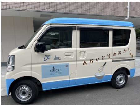
キッチンカー左面