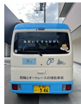
キッチンカー 後面