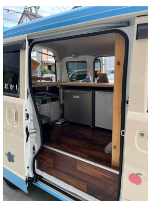
カウンター内部 (左スライドドア)