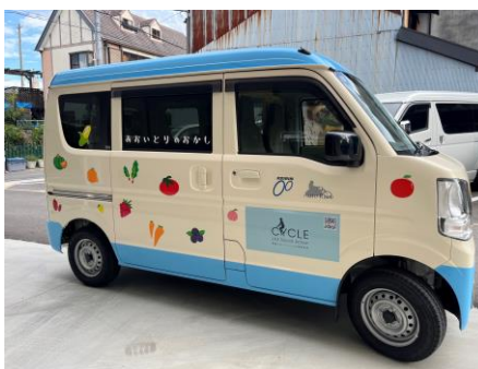
キッチンカー 右面