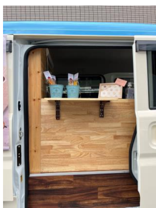
販売カウンター (右スライドドア)